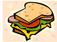
Sándwich de pavo