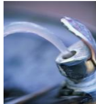
Bebida de agua