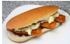
Sándwich de pescado frito