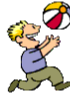
Corriendo y jugando

11. Encierra en unos círculos todos artículos que te ayudan a mantenerte saludable. (Puede círculo de más de uno)