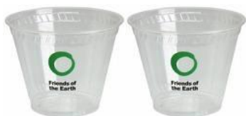
Dos tazas de granos/lentejas/chícharos secos