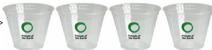
Cuatro tazas de agua

Regla: Dos tazas de agua para cada una taza de de granos/lentejas/chícharos secos.