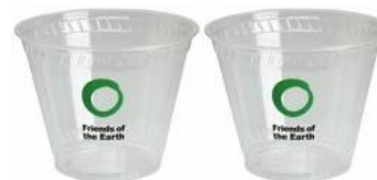
Dos tazas de agua